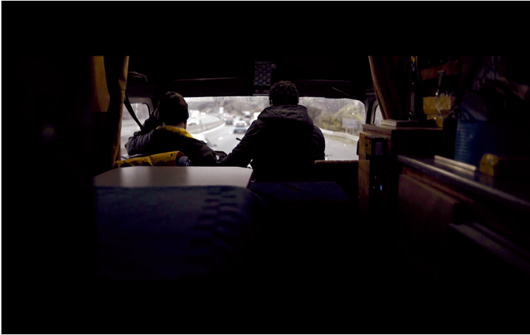
Figura 6.1 Inquadratura tratta dal film Talien di Elia Moutamid (2018). La camera si allontana dai protagonisti quando parlano di eventi dolorosi

intensa attività imprenditoriale ha contribuito in maniera negativa alla salute della moglie, che soffre di depressione. Aldo inizia a parlare di questo tema in arabo, ma la conversazione finisce in italiano quando Elia interroga il padre riguardo alla sua decisione di partire chiedendogli: «E la mamma cosa farà adesso?». Se le lingue in comune costituiscono un elemento di unione tra padre e figlio, il repentino cambio di lingua in questa scena segnala un disaccordo tra i due.