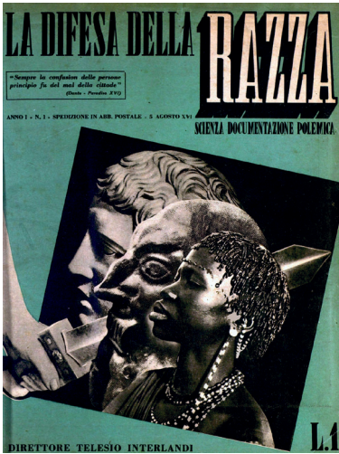
Figura 7.1 La copertina del primo numero della rivista La difesa della razza (1938). Fonte: https://anpi.it/media/uploads/files/2017/12/difesa_della_razza_a1_n1.pdf