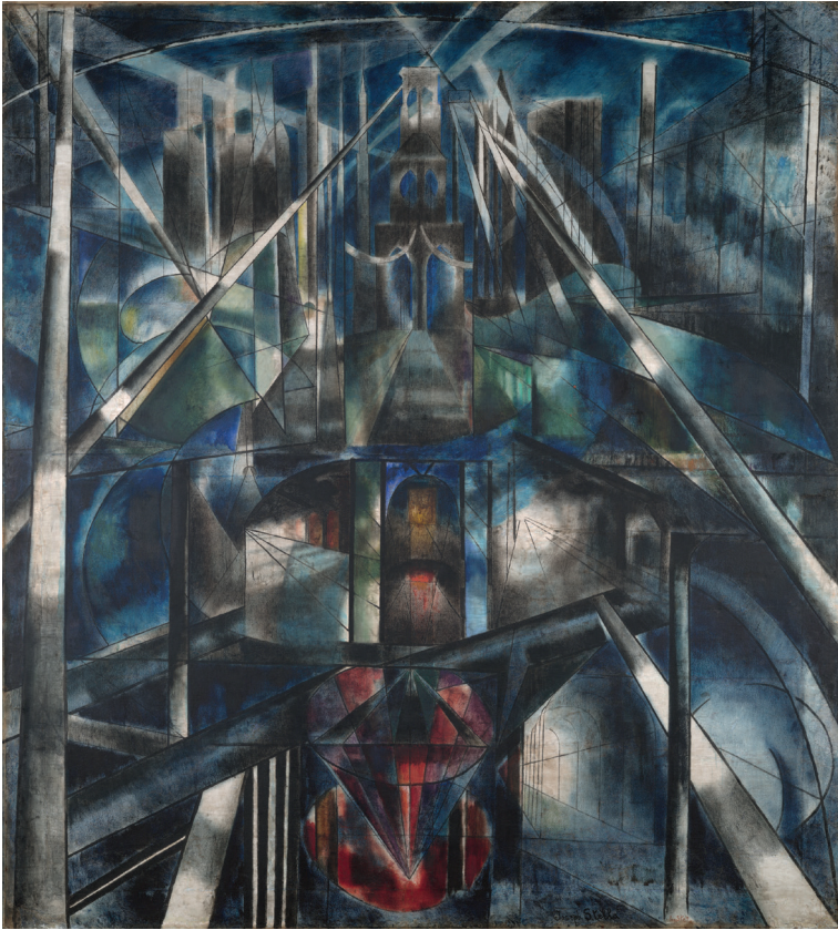
Figura 1.1 Joseph Stella, Brooklyn Bridge (1919-20). Olio su tela, 215,3 × 194,6 cm.

Brooklyn rappresentato in queste opere potrebbe essere visto non solo come un dipinto capace di cogliere «the spiritual dimensions of urban industrial experience inhered in its visual materiality» (le dimensioni spirituali dell'esperienza industriale urbana ereditate dalla sua materialità visiva) (Ferraro 2005, 44), ma anche di assurgere ad una delle funzioni principali delle cattedrali: quella di ricordare e pregare per i defunti, in questo caso le numerose vite spese per la sua costruzione. Secondo questa lettura, le tonalità scure nel dipinto sarebbero state utilizzate per mostrare la continua minaccia di morte a cui i lavoratori sarebbero sottoposti, nonché per dipingere il ponte come un simbolo del passaggio tra la vita e la morte.