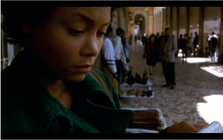
Figura 2.7 Inquadratura tratta da L'assedio di Bernardo Bertolucci (1998). Shandurai (Thandie Newton) sfugge alle indesiderate attenzioni di Jason Kinski (David Thewlis) rifugiandosi a Piazza Vittorio Emanuele II, un luogo così diverso nella sua composizione sociale dai pressi di Piazza di Spagna in cui è ambientata la maggior parte del film