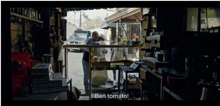
Figura 6.3 Inquadratura tratta dal film Talien di Elia Moutamid (2018). L'arrivo dei protagonisti a Fes visto dall'interno di una bottega

era rientrato clandestinamente in Italia dopo aver pagato un doganiere connivente. Al confine con la Francia, Elia mostra apertamente la propria insofferenza per le frontiere e per l'inasprirsi dei controlli a seguito degli attentati di Parigi del 13 Novembre 2015. Questa scena è in aperto contrasto con la narrazione egemonica dell'Islam come religione di violenza spesso presente nei media italiani (Burdett 2017). Elia e Aldo sono rappresentati come credenti, dato che entrambi pregano rivolti alla Mecca in una scena del film. Tuttavia, Aldo ripete le bestemmie dell'organizzatore di trasporti clandestini che lo ha fatto varcare il confine, mostrando un'attitudine non dogmatica e inusuale ad una religione spesso rappresentata in Occidente come monolitica e impositiva. In uno dei dialoghi più interessanti del film, Aldo s'interroga sulla libertà religiosa in Italia e sul paradosso per cui questo diritto è nominalmente tutelato dalla legge, anche se molti musulmani si ritrovano spesso a pregare nelle cantine nella vita di tutti i giorni. Il padre di Elia ci informa inoltre del fatto che gli imam non affrontano più temi politici nei loro sermoni e si limitino a condannare chi interpreta in maniera violenta il significato della Jihad, visto che il Dio rivelato dal Corano vieta di fare del male al prossimo.