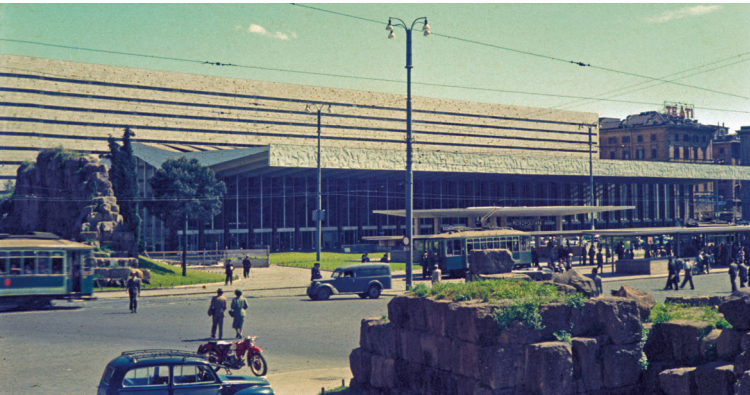
Figura 2.1 Stazione Termini nel 1956. L'esterno della stazione nella sua configurazione attuale.

utopias crystallize in realized form» (come agli antipodi dell'utopia, essendo quest'ultima immaginaria, mentre le eterotopie sono disposizioni reali, cioè il modo in cui le utopie si cristallizzano nella loro forma realizzata) (Foucault 2008, 25, commento dei traduttori).