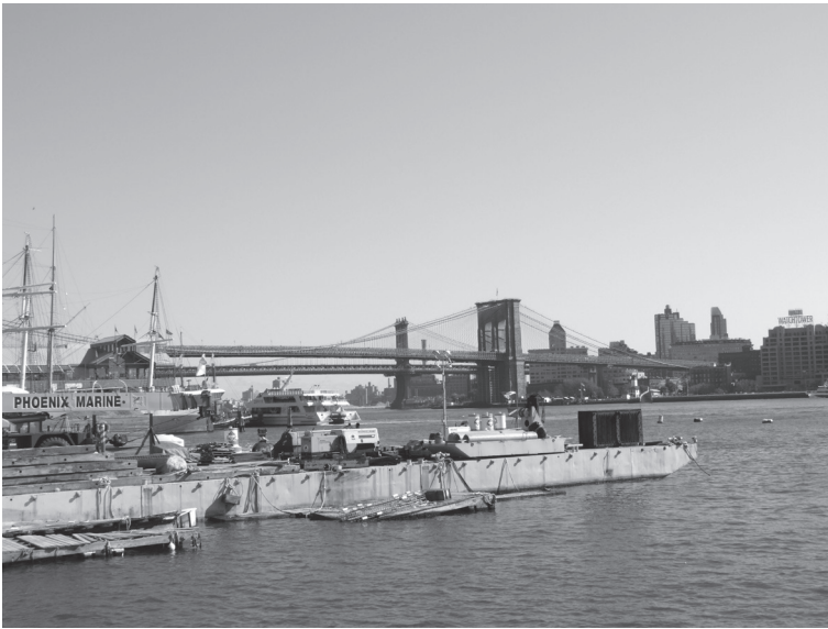
Figura 1.2 Inquadratura tratta da Vue du Pont di Sidney Lumet (1962). Il ponte di Brooklyn visto da Red Hook